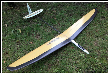
代表的無人航空機の特徴 (自作機)