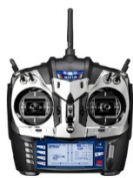
代表的な操縦装置 (プロポ)